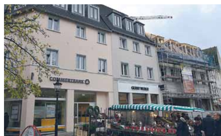
Nach mehr als zehn Jahren sind die Baulücken rund um den Ratinger Markt nun endlich geschlossen – Anfang Dezember wurde zum letzten Mal am Markt 17 bis 20 Richtfest gefeiert. Mit der Fertigstellung der ansprechend angepassten und zugleich modern nutzbaren Markthäuser wird die Altstadt wieder viel attraktiver – nicht zuletzt deshalb, weil jetzt auch ein erweitertes hochwertiges Einzelhandelsangebot die Einkaufsmöglichkeiten erweitern wird.