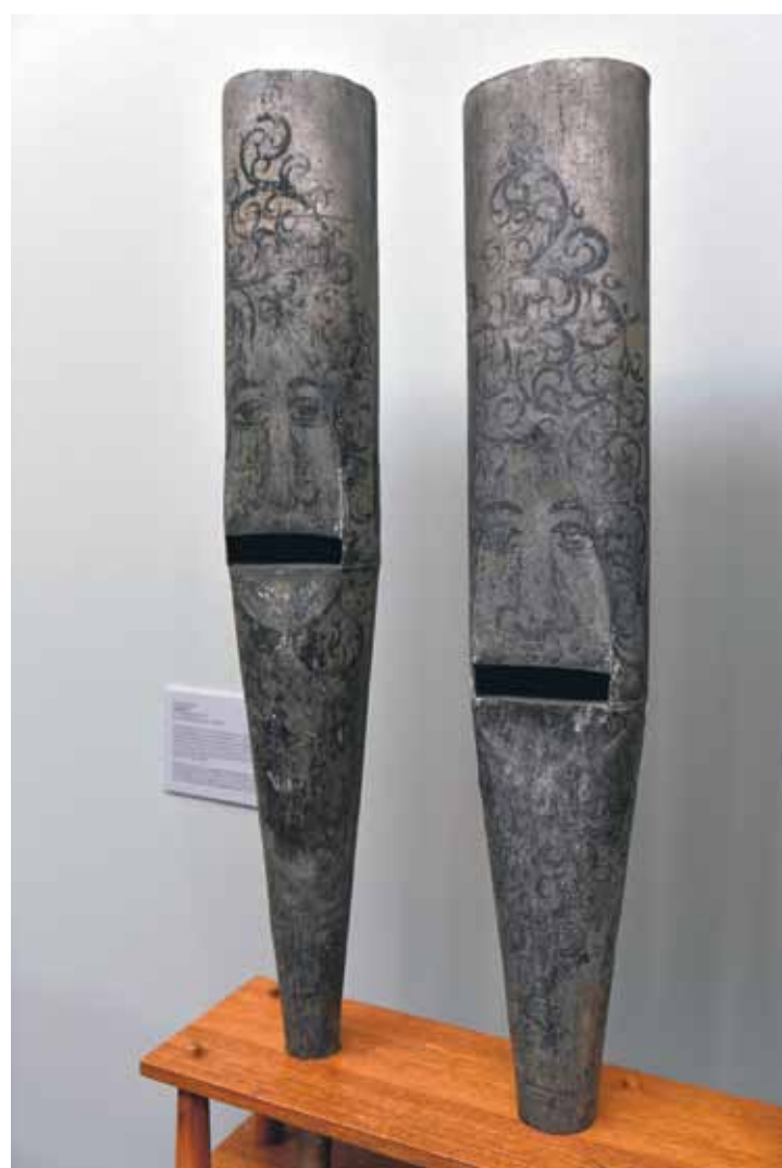
In der neu arrangierten stadsgeschichtlichen Ausstellung stehen sie, die Orgelpfeifen – aus Zinn gefertigt, mit kunstvoll aufgemalten und verzierten Gesichtern. Sie stammen vermutlich aus der Werkstatt des Ratinger Orgelbauers Weidmann.

18 Uhr, samstags und sonntags von 11 bis 18 Uhr geöffnet und nimmt für die Dauerausstellung Eintrittspreise von drei Euro, (reduziert 1,50 Euro). Weitere Informationen: www.museum-ratingen.de