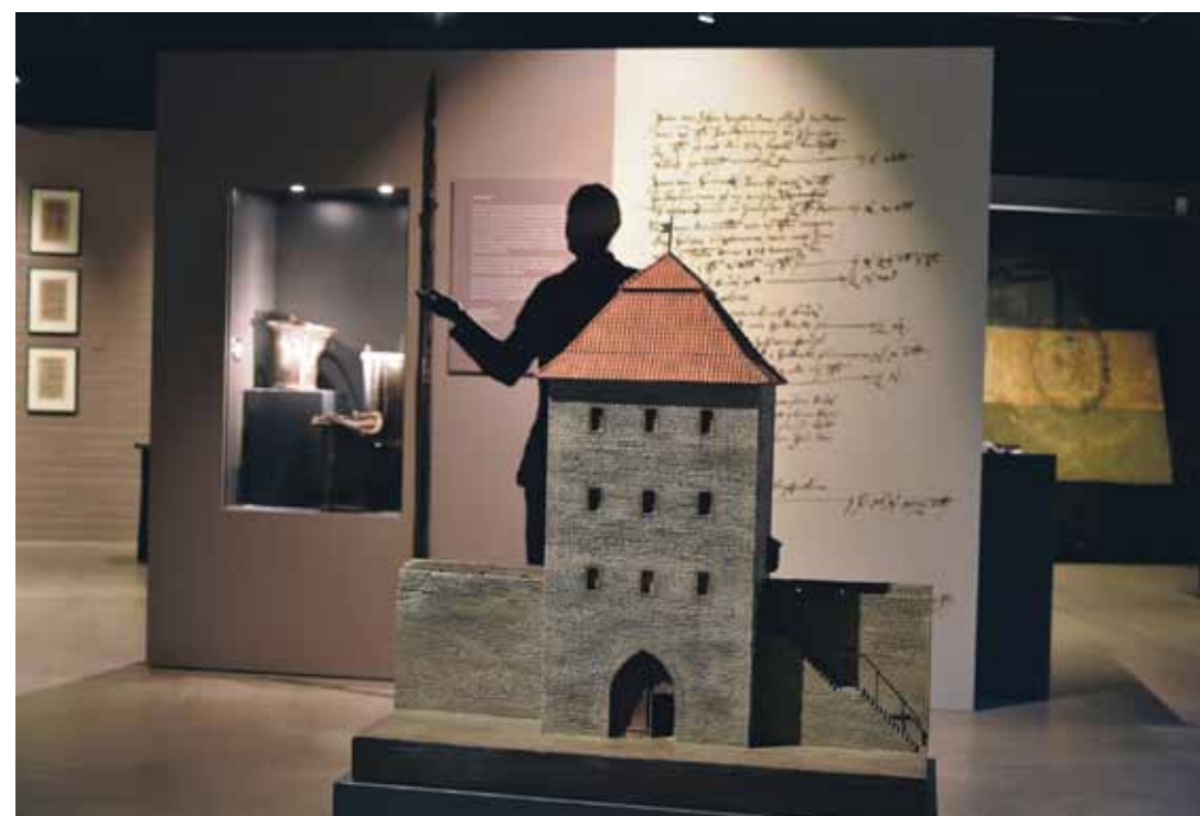
Heute erinnert eine Platte auf der Straße an den Standort des Lintorfer Turms. Es gehörte bis Ende des 19. Jahrhunderts zum Stadtbild. Im Museum Ratingen kann man ein Modell betrachten, das 1926 zur 650-Jahr-Feier der Stadtgründung angefertigt wurde.

Wem ist es gegenwärtig, dass Anger und andere Gewässer den Schmiede- und Schleifhandwerkern zupass kamen? Dass aber auch Pestilenz die Bevölkerung minimierte und Horden von Soldaten jeglicher Herkunft in der Garnisonsstadt das Stadtsäckel schröpften?