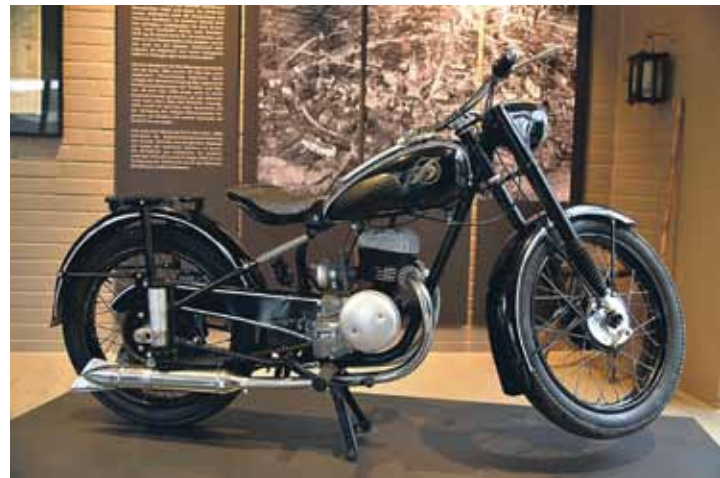
Die Hoffmann-Werke produzierten Fahrräder und Motorräder – hier ein gleichermaßen gut geputztes wie gut erhaltenes Exemplar. Später wurde am Standort Lintorf auch die Vespa in Lizenz gebaut.

herstellung benötigten Kräuter- und Würzstoff, baute die Stadt, 55 bis 180 Meter über Null, die mächtige Stadtmauer mit großen Verteidigungstürmen