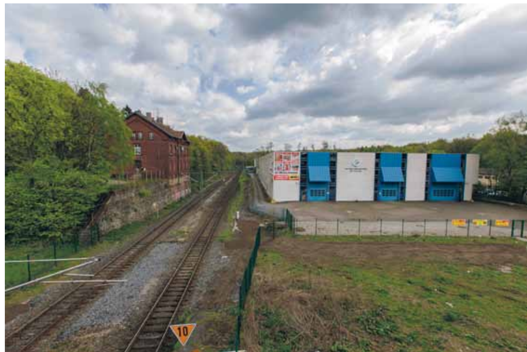
Das Gelände der ehemaligen Tapetenfabrik Goldkuhle liegt direkt gegenüber dem Höseler Bahnhof – Platz genug zum Wohnen, Einkaufen und urbanem Leben.

Die CDU hat daher den Antrag gestellt, an dieser Stelle den Neubau eines Kreisverkehrs zu planen, um eine geregelte Zu- und Abfahrt von und zu Goldkuhlegelände und Bahnhof zu gewährleisten. Ein durchaus gewünschter Nebeneffekt eines solchen Kreisverkehrs wäre eine „natürliche“ Temporeduzierung für die Fahrzeuge, die von der Brücke kommen und die regelmäßig mit gefährlicher, weil deutlich überhöhter Geschwindigkeit nach Hösel einfahren.