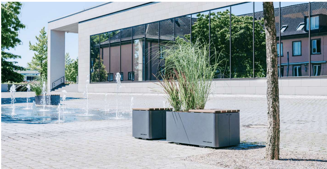
Beispiel des Einsatzes der Tankbank in Coesfeld vor dem Konzerttheater