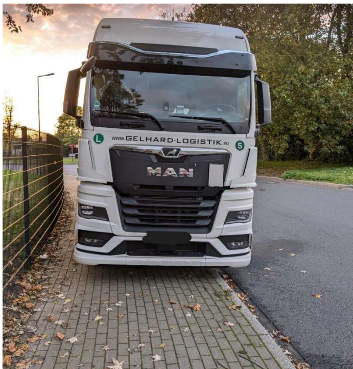
Abgestellte LKW im Bereich „An den Dieken“