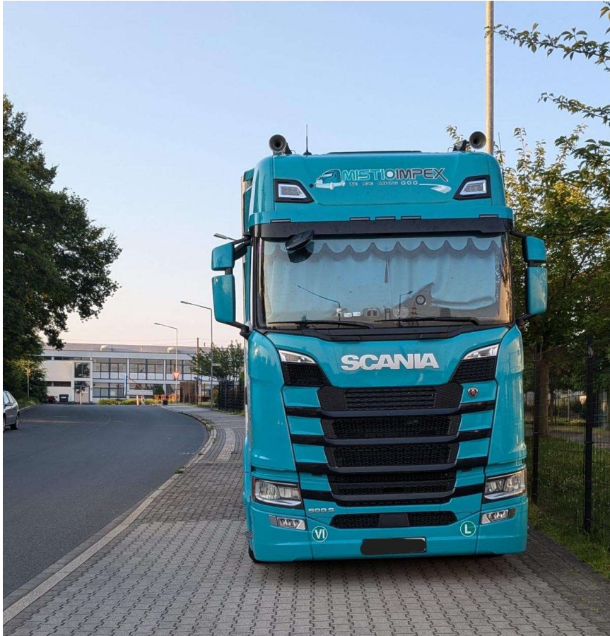
Abgestellte LKW im Bereich „An den Dieken“