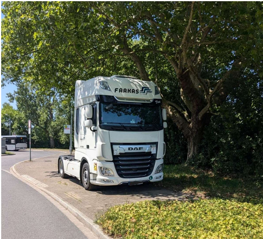
Abgestellte LKW im Bereich „An den Dieken“