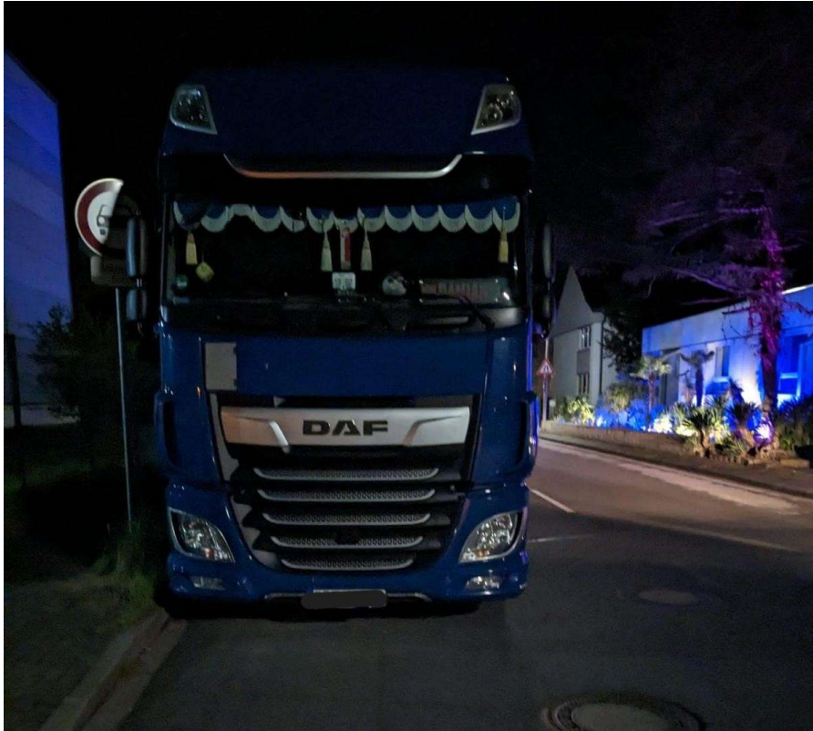
Abgestellte LKW im Bereich „An den Dieken“