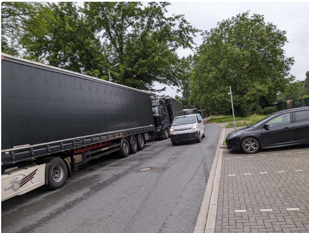
Abgestellte LKW im Bereich „An den Dieken“